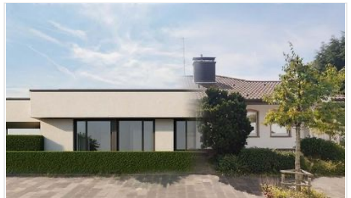
Aus ALT wird NEU - Straßenansi