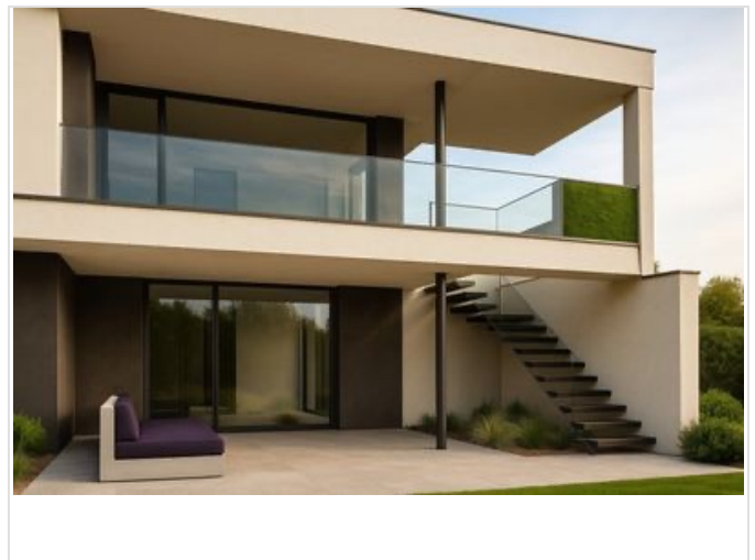
Detail Treppe zum Garten