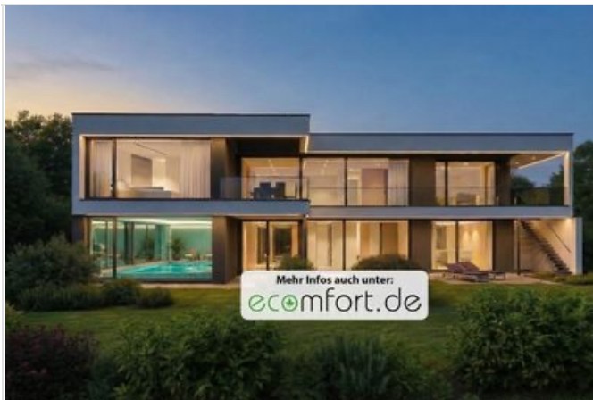
Gartenansicht bei Abend