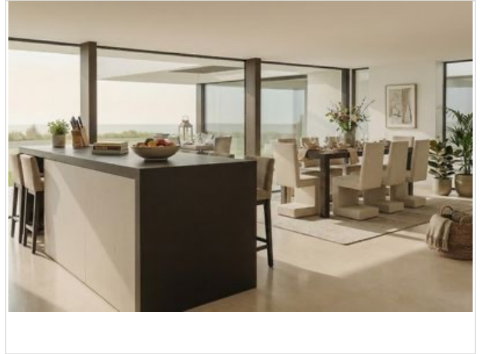
Küche und Essbereich mit Ausblick