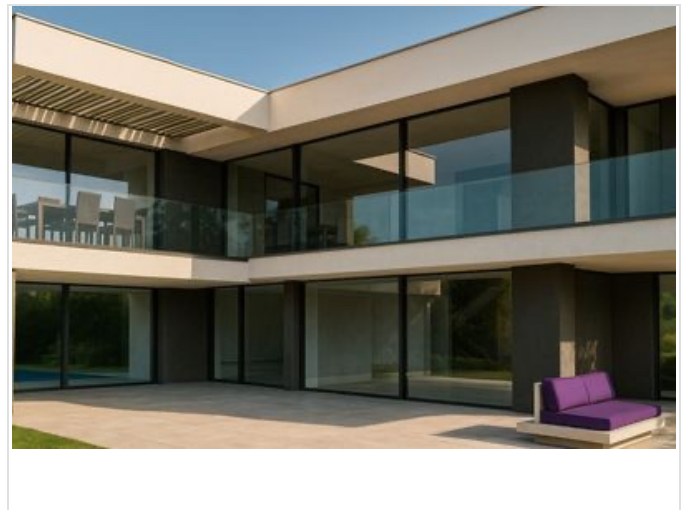
Terrassen und Balkone